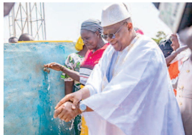
Le Ministre Amadou Coulibaly inaugure un ouvrage d'eau courante.

Sécurité locale : création de la 6 e compagnie du Groupement de Sécurité et de Protection Mobile (GSPM), construction de sa caserne, ouverture de nouveaux postes de police de proximité et renforcement des services de sécurité dans la région.