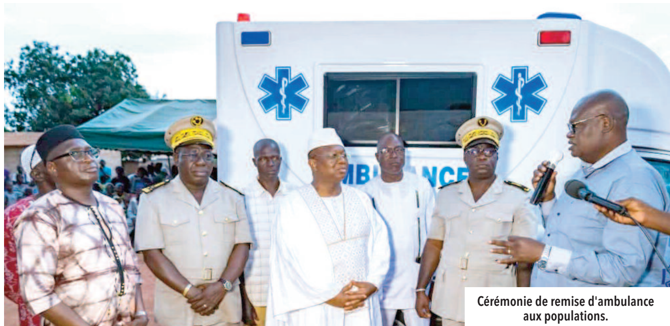
Cérémonie de remise d'ambulance aux populations.