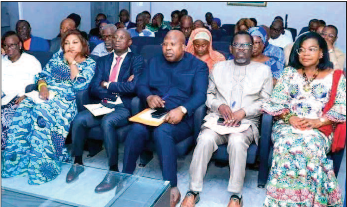
...les responsables des différentes structures du parti pour évoquer la dernière ligne droite des législatives.