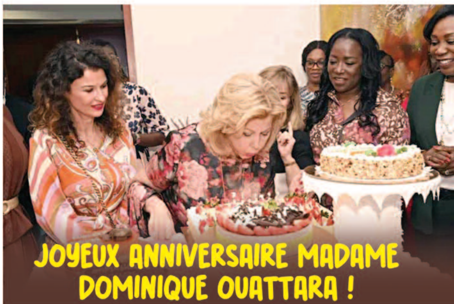
JOYEUX ANNIVERSAIRE MADAME DOMINIQUE OUATTARA !