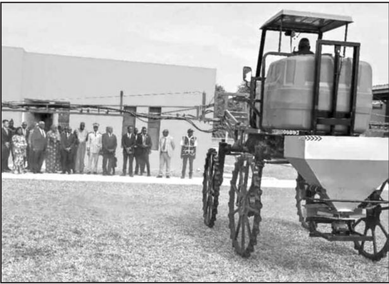
Le lycée professionnel de Gbéléban, qui accueille ses premiers étudiants, offre des débouchés professionnels à la fin de l'apprentissage.